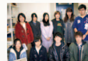
松本大学 支援会ゆにまる

〒390-1295 松本市新村2095-1 TEL 0263-48-7200 FAX 0263-48-7290 E-mail:www@matsu.ac.jp http://www.matsumoto-u.ac.jp