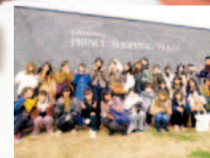
松商短期大学部 金子ゼミ

「地域貢献」を基本理念として、学生一人ひとりを大切にした人間教育を行っています。特に地域での学びを通して、社会活躍することができる人材育成のための、独自の実践教育を展開。こうした地域連携教育や教員の研究分野を生かして、地域コミュニティの中核的存在としての大学の機能強化をはかり、高等学校とも連携しています。