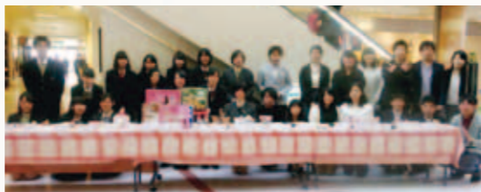
2014年第1回商品発表会の様子