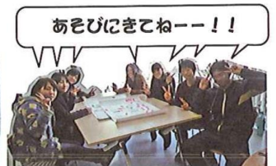
▲私達があるぷあタウン実行委員です！