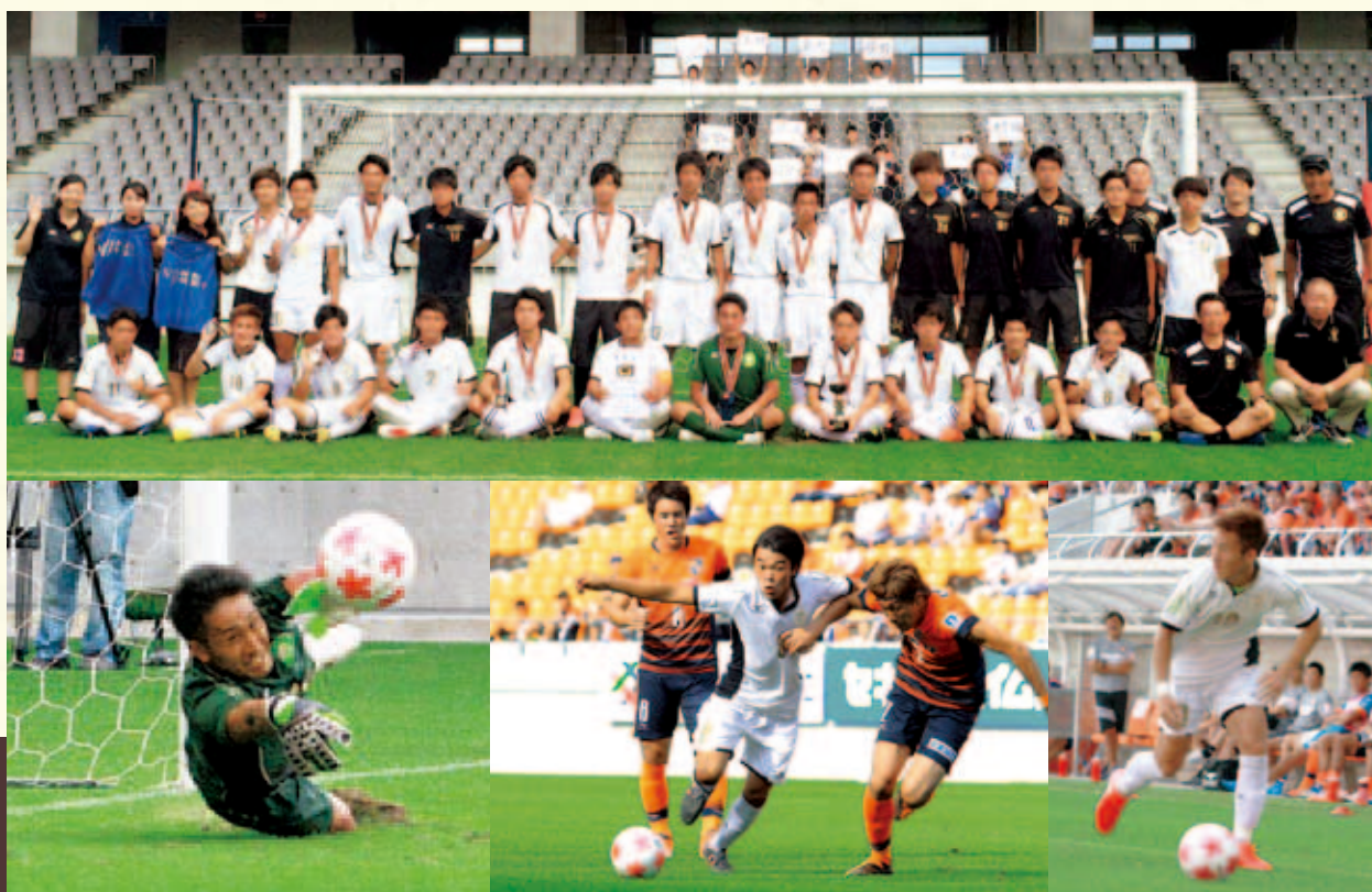
長野県サッカー選手権で準優勝した男子サッカー部 (詳しくはP14をご覧ください)