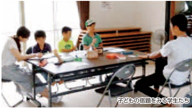
子どもの宿題をみる学生たち

この夏に始まったばかりの学生の学習支援活動ですが、石巻での活動を通じて学んだように、またこの活動での学びは多いものになるでしょう。