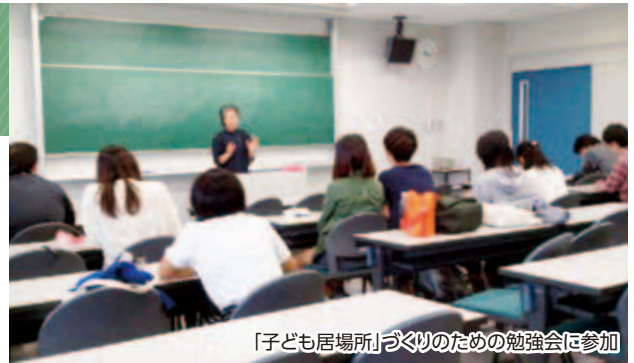
「子ども居場所」づくりのための勉強会に参加

この背景には、子どもの生活の変化があります。「一人で留守番」、「一人で食事」という環境に置かれている子どもは実は少なくありません。この取り組み自体、夏休みをきっかけに、自宅以外に居場所を一箇所つくることのできないかとの模索です。ある地域の自治会からの声が基盤となって始まりました。特徴は、活動支援機能（団体）と地域の町会との連携で場所が設定されていることです。子どもとどう関わるかという観点と、子どもの環境をどう地域で構築できるかという観定の二つがあることです。