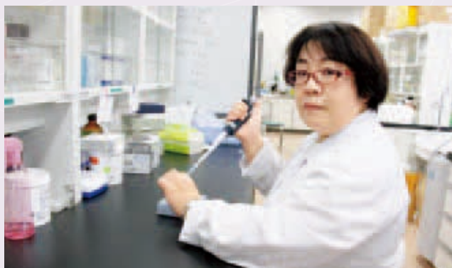
単にアレルギーの人が食べられるメニューを考案するだけでなく、それが安全かどうかを実験的に調査

大学院時代に免疫やアレルギーに関して研究していたので素地はありましたが、本格的にアレルギー研究へ舵を切ったのは、自分自身のアレルギーが酷くなったこの5年ほどです。小学生の頃は蕁麻疹と喘息に悩まされていましたが、20歳を過ぎたら嘘のように体調が良くなりました。ところが、毎日のように光化学スモッグ注意報が出ていた東京都心に住んでいたときは何ともなかったのに、環境の良いはずの松本へ転居してきたら、来た年の秋以降、夜になると毎日顔中に蕁麻疹が出るようになり、翌年春先に喘息が再発。その後、昨年に